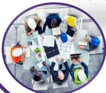
ועדת בטיחות מעריך בטיחות