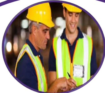
ממונה על בטיחות