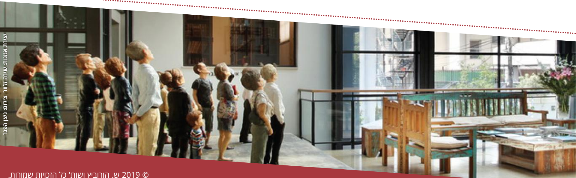
צילום: אמנות - שירה זלור, צילום: ניצן הפני