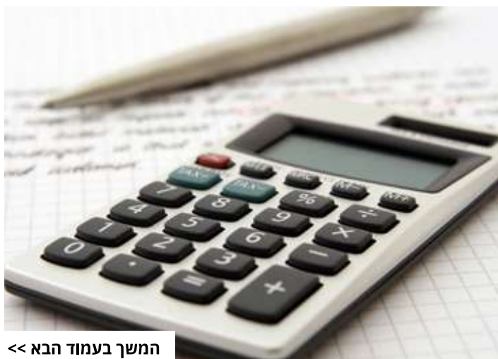
המשך בעמוד הבא <<